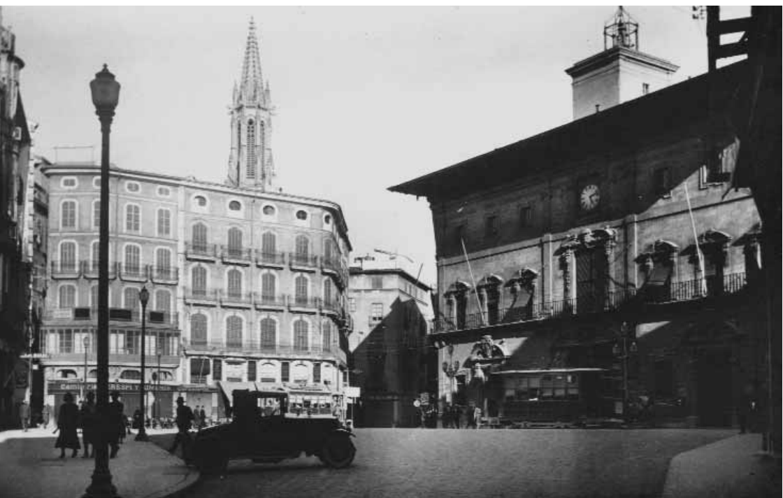
Plaçã de Cort