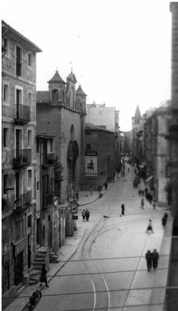
Carrer de Sant Miquel i església de Santa Catalina de Sena