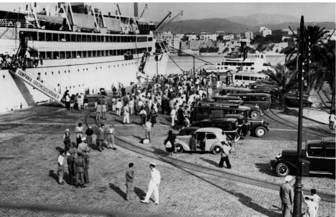
Moll de Palma. L'arribada del "correu"