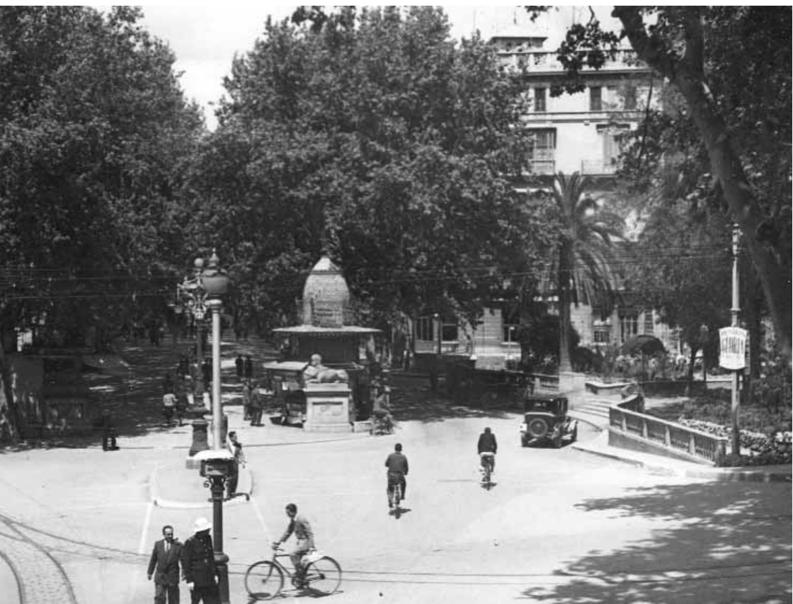
Plaça de la Reina