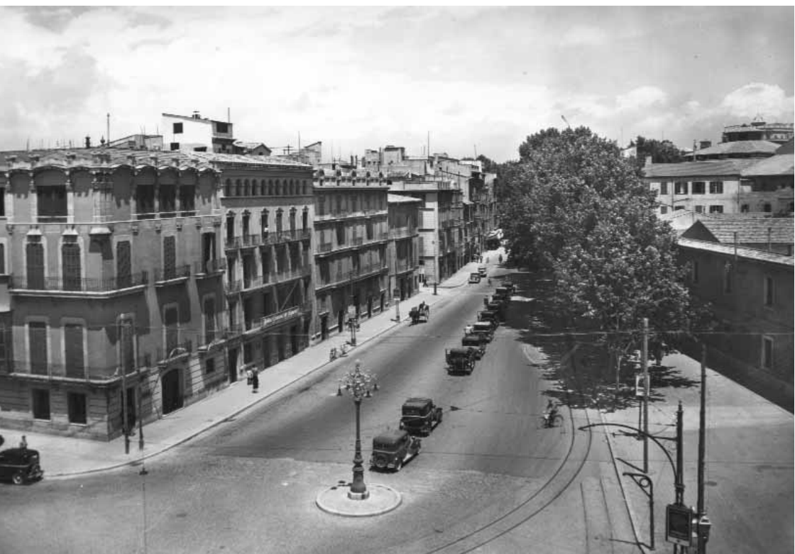
Avinguda d'Antoni Maura