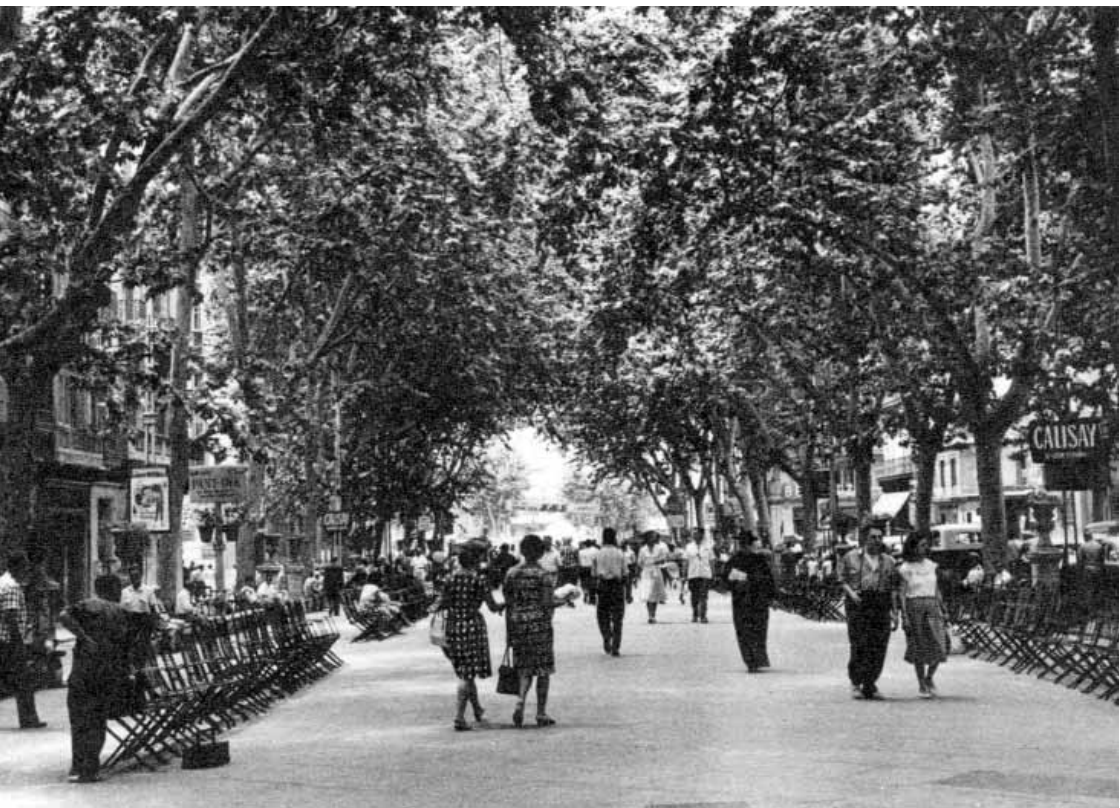
Passeig del Born